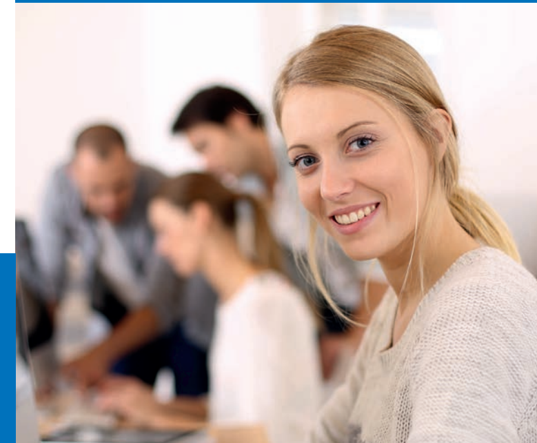
FOS für Wirtschaft und Verwaltung